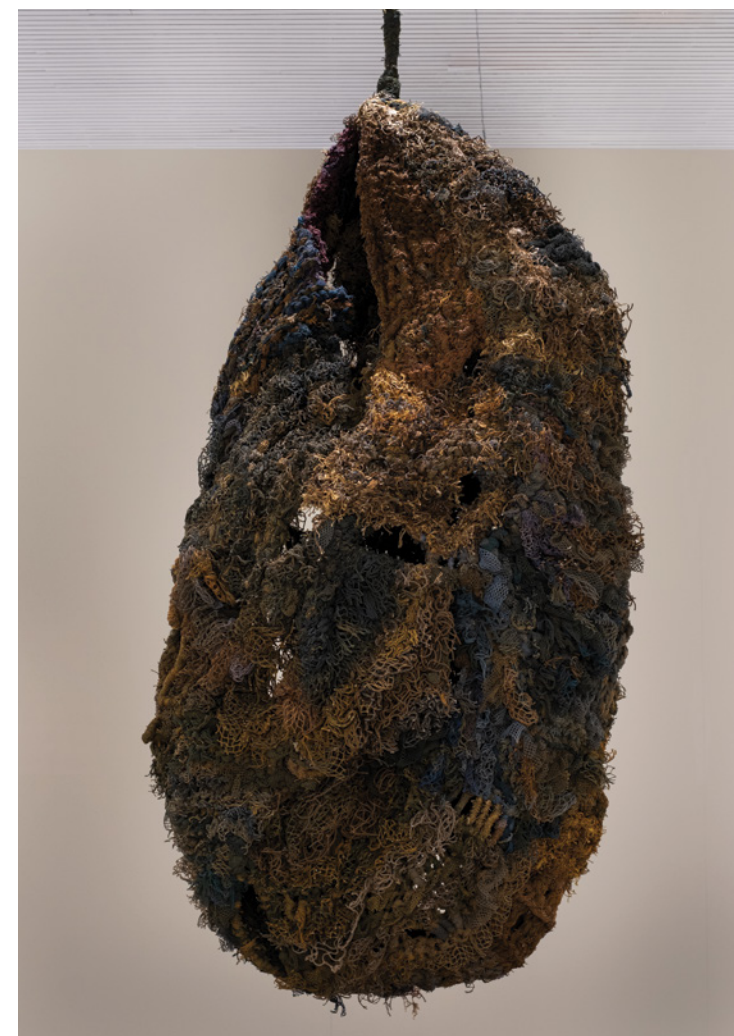
Ninho, 2023 Reúso de redes de pesca oxidadas com pó de ferro e vinagre, arame galvanizado, enchimento de sobras de roupas de descartes da indústria da moda, enrolamento de fios

Guichon frequently incorporates industrial fishing nets into her works, a durable yet highly polluting material, transforming discarded waste into new artistic possibilities. Through processes of reuse and reinvention, her work proposes reflections on environmental responsibility, material transformation, and more sustainable forms of production and consumption.