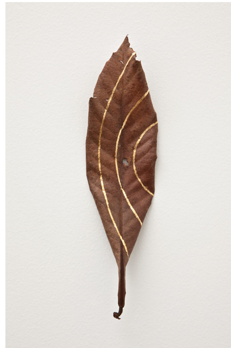
Masks, 2012 Folha de caboatã-de-leite e folha de ouro

In the Masks series, Steegmann Mangrané explores geometry, materiality, and perception, questioning conventional distinctions between form and surface, abstraction and representation, as well as the boundaries between the natural and the constructed world.