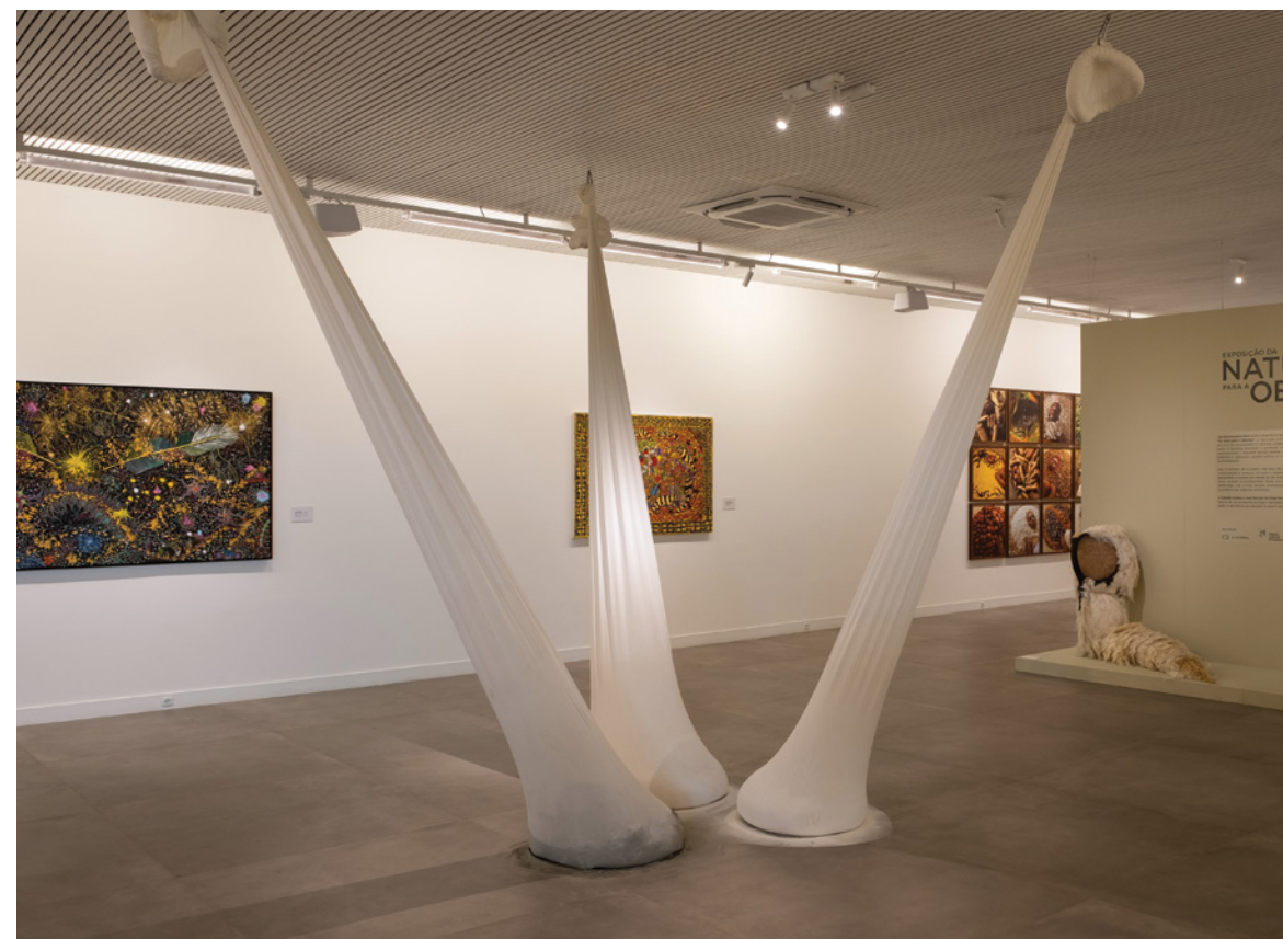
Venus Quarts Paff, 1997 Cimento de gesso e tecido tubular de poliamida

Nature occupies a central place in Neto's work not only through the visual language of his sculptures, but also through the relational and interdependent character of the spaces he creates. Designed to be explored, inhabited, and experienced collectively, his installations encourage encounter, exchange, contemplation, and reflection. The viewer becomes an active participant, integrating into the work as a living presence within the environment itself.