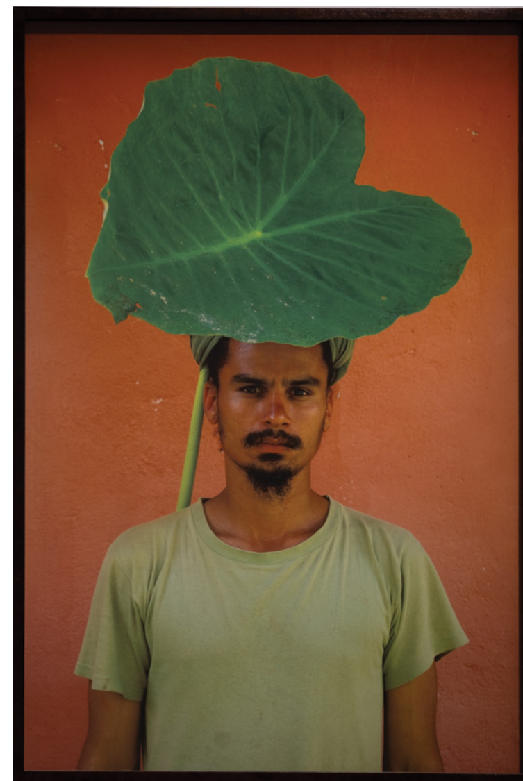
Sem título, da Série "Objetos para tapar o sol de seus olhos", 2011 Impressão fotográfica 2/5 + P.A.

Bringing lived experience into the exhibition space, the artist places his own body at the center of the work. His presence carries questions of race, class, displacement, and history, transforming the body itself into a central element of artistic and political reflection.