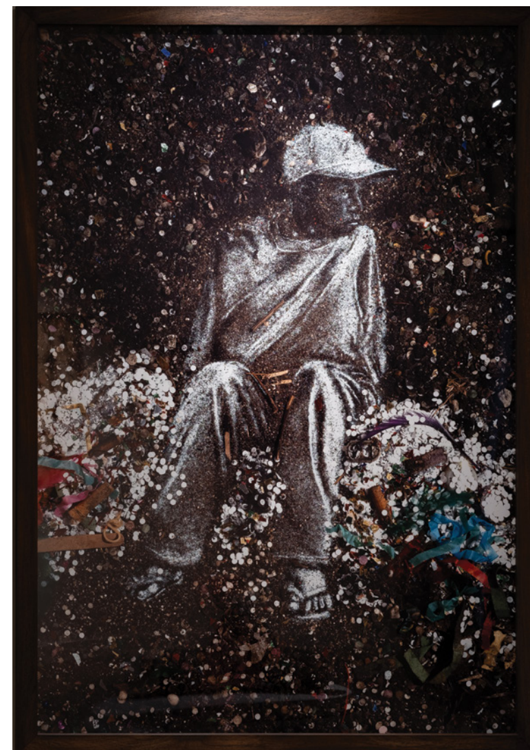
Angélica (Aftermath), 1998 Cópia fotográfica por oxidação de corantes 2/10

Through this process, the work brings together art history, social reality, and material transformation, while questioning visibility, representation, and the relationship between image and lived experience.