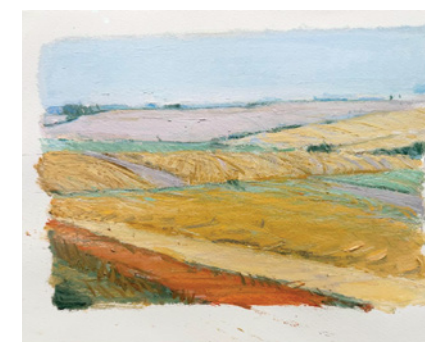
Sem título, 2013 e 2014 Óleo sobre papel 24 x 33 cm