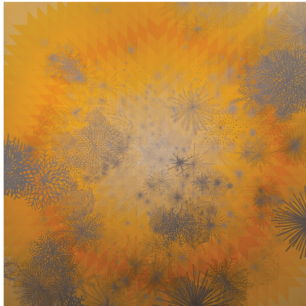
Sol Amarelo, 2008 Acrílica e caneta permanente sobre MDF

Nature, especially the sky, the sea, and the mountains, remains a constant presence throughout her artistic practice, shaping poetic and contemplative environments. As the artist reflects: “Everything I do becomes landscape. My relationship with the sky, the sea, and the mountains is always present in my work. I think that, because I live in a place disconnected from nature, I create my own landscapes.”