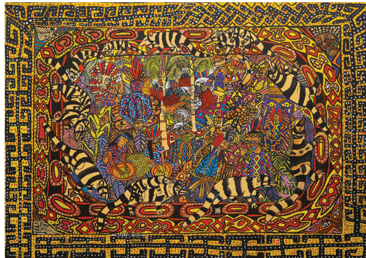
Txain Punke Ruaken, 2021 Acrílica sobre tela

His works bring together human and non-human figures within intricate graphic structures that challenge Western conventions such as perspective and proportion. Rooted in the cosmology of the Huni Kuin people, his paintings express the myths, cultural memory, and spiritual dimension of his community.