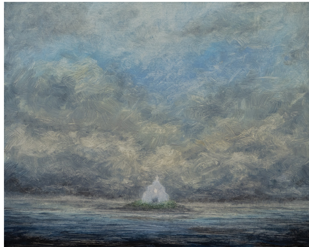
Sem título, 2015 Óleo sobre tela

Exploring the boundaries between figuration and abstraction, the artist develops works in which the repetition of formats and recurring motifs reinforces a meditative and almost silent quality, inviting viewers into a slow and attentive mode of observation.